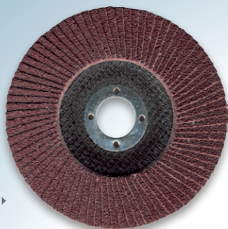
ОКСИД АЛЮМИНИЯ ① >

■ Для грубой и промежуточной шлифовки стали, цветных металлов, древесины и пластмасс. Лепестковый шлифовальный диск с основанием из стекловолокна. «Холодное» шлифование, низкий уровень шума, стабильные результаты. Применяются для обдирки, зачистки, удаления ржавчины при кузовных и столярнослесарных работах.